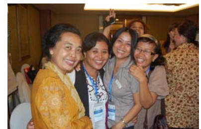
AG Nila, Fina, Suzana & Bandana's lady