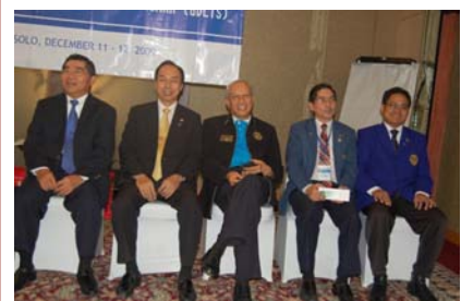
Para PDG,DG dan DGE