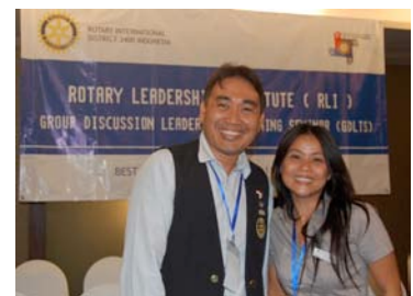
PE dan Secretaris