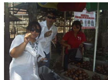
First and half stop