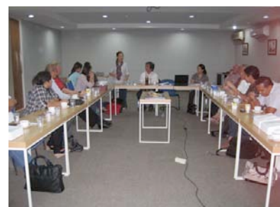
maunya semua masuk photo